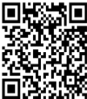
St. Stephanus Borne

Het pastoraal team en het parochiebestuur, zouden het zeer op prijs stellen als u, uw en onze parochie, wilt steunen. U kunt dit doen door uw bijdrage over te maken op: